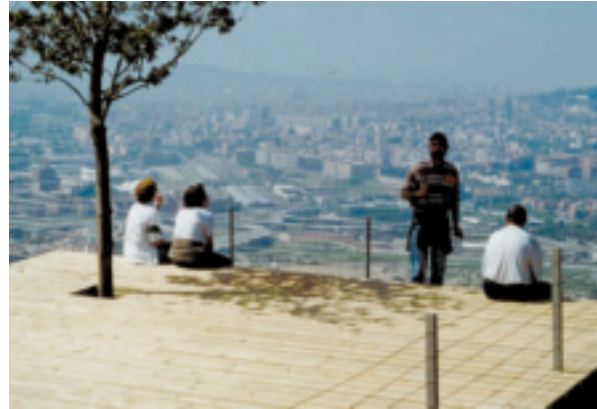
Miradas del "Puig Castellar".