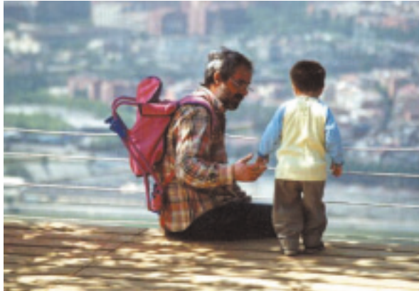
Miradas del "Puig Castellar".