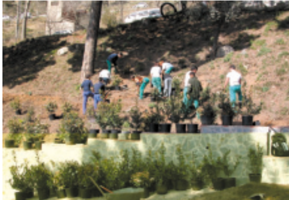
Alumnos en la Escuela Taller.